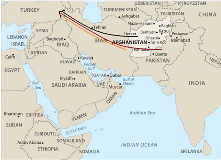
Şekil 1. Afganistan, İran ve Pakistan'daki Afganların Türkiye'ye Göç Rotası

Zorla yerinden edilmiş yaklaşık 5,7 milyon Afganistan vatandaşının 2,9 milyonu ülke içi yerinden edilmiş kişiler, 2,8 milyonu ise mülteciler/sığınmacılardan oluşmaktadır. 2020 yılı itibarıyla dün-