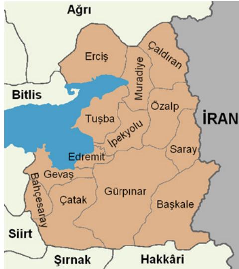
شکل ۲. استان وان و مناطق آن

مهاجران ورودی از شرق ترکیه به غیر از مرز وان از استان های مرزی مانند Agiri و Hakkari نیز وارد می شوند. با این حال، مرز وان به دلیل ساختار کوهستانی ترجیح داده می شود و این امر گذرگاه های مرزی را تسهیل می کند. دو نقطه اصلی ورودی به وان وجود دارد، یعنی ولسوالی های چالديران و باشکاله. برخی از دارندگان گذرنامه از طریق دروازه های مرزی Kapıköy یا Gürbulak وارد می شوند و در ترکیه فراتر از مرزهای قانونی اقامت می کنند و مهاجران "نامنظم" می شوند.