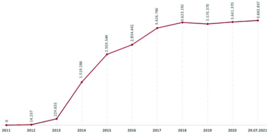
نمودار 1- اتباع سوریه مشمول اقامت موقت بر حسب سالها